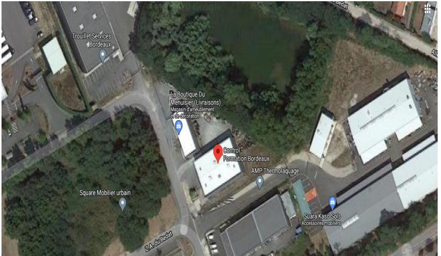
Figure 2 - Terrain d'activité R482 / R490/R487