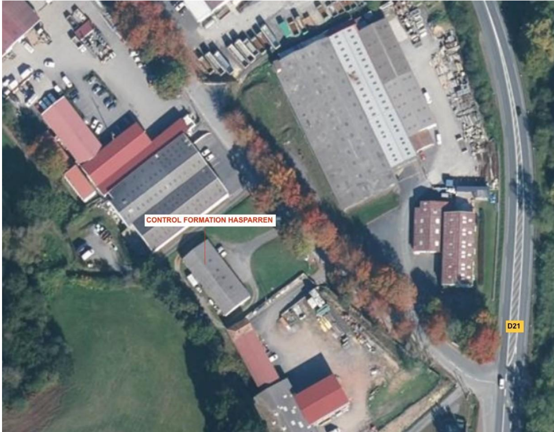
Figure 2 - Terrain d'activité R482 / R490